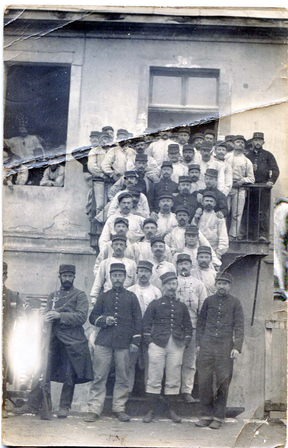
Au 30 RI avant son départ pour le front. 2ème rang à droite